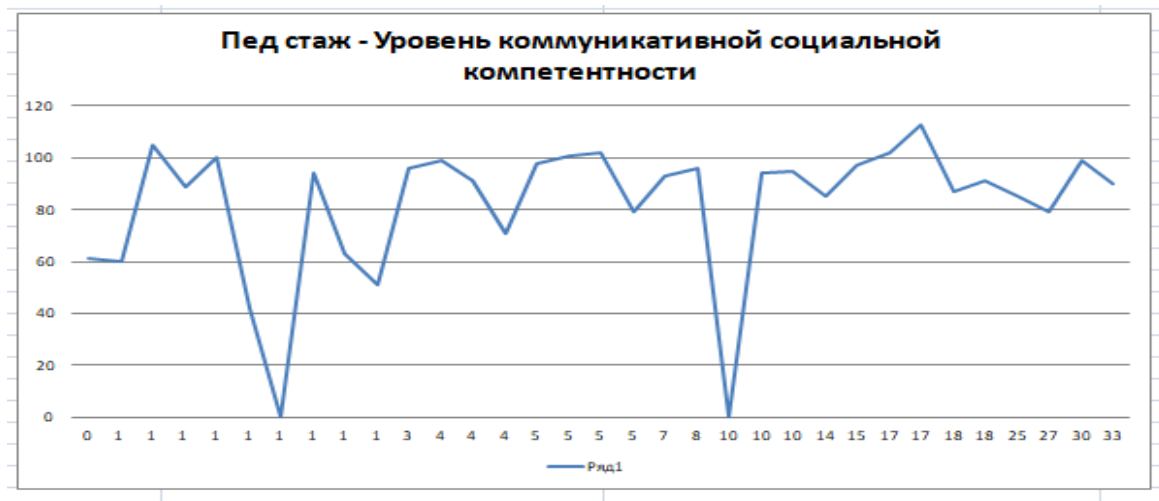
Рисунок 1 – Взаимовлияние педагогического стажа на уровень коммуникативной социальной компетентности [разработано автором]

Динамика показателя «коммуникативная толерантность» рассчитанная автором, представлена на рис. 2.